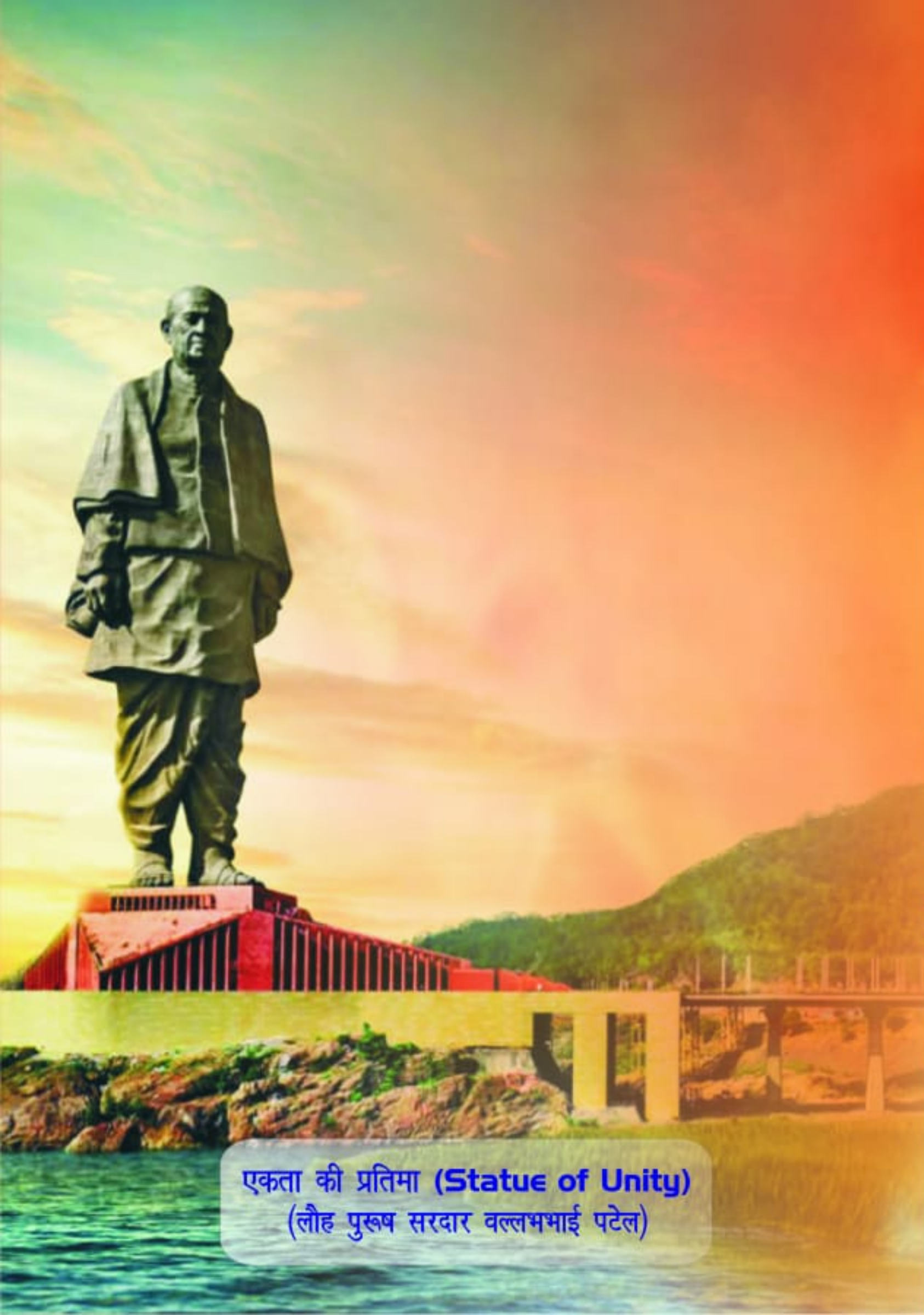
एकता की प्रतिमा (Statue of Unity) (लौह पुरुष सरदार वल्लभभाई पटेल)