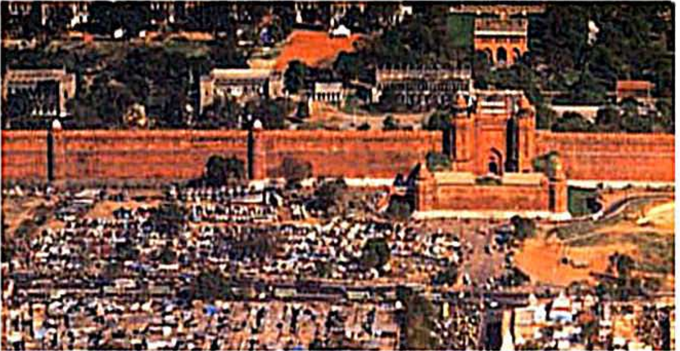
लाल किला (दिल्ली)

यदि अकबर ने इस तरफ ध्यान दिया होता और पता लगाया होता कि संसार के दूसरे हिस्सों में क्या हो रहा है तो उसने सामाजिक परिवर्तन की बुनियाद रख दी होती। बड़ी समस्या यह थी कि वह इस्लाम के साथ राष्ट्रीय धर्म और लोगों के रीती-रिवाजों का मेल कराके राष्ट्रीय एकता कैसे कायम करें।